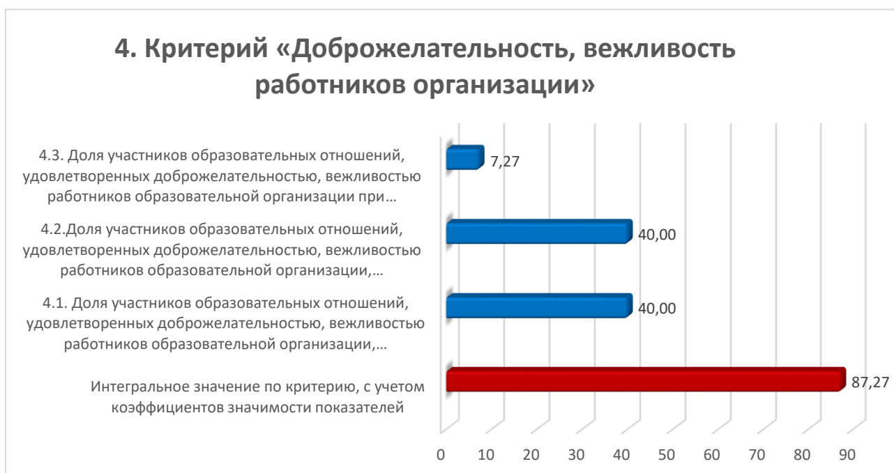
Диаграмма № 5