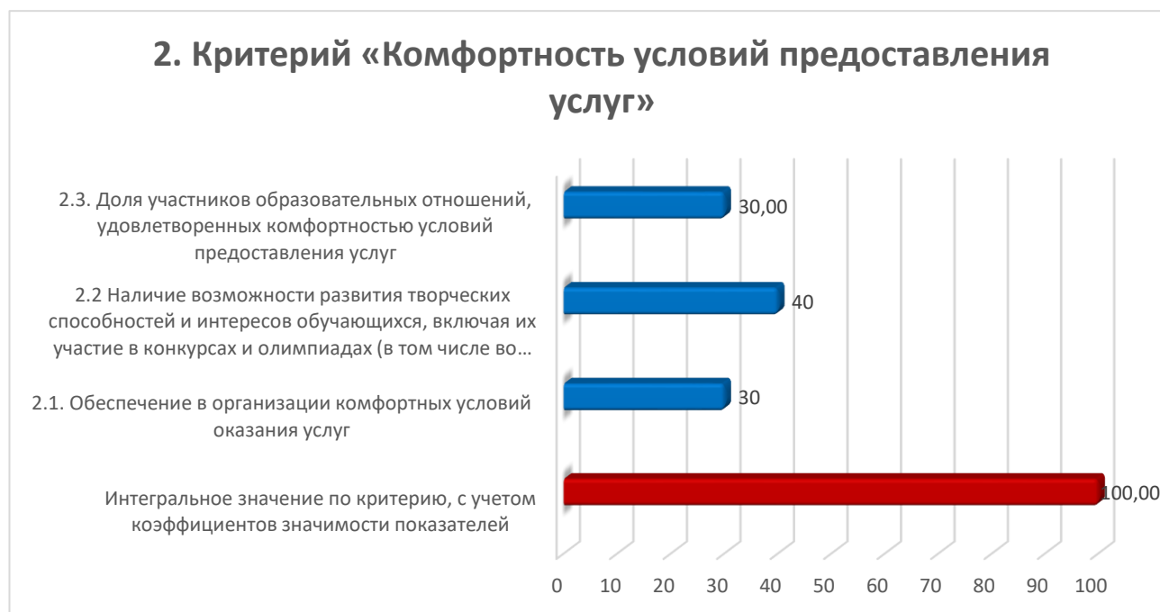
Диаграмма № 3